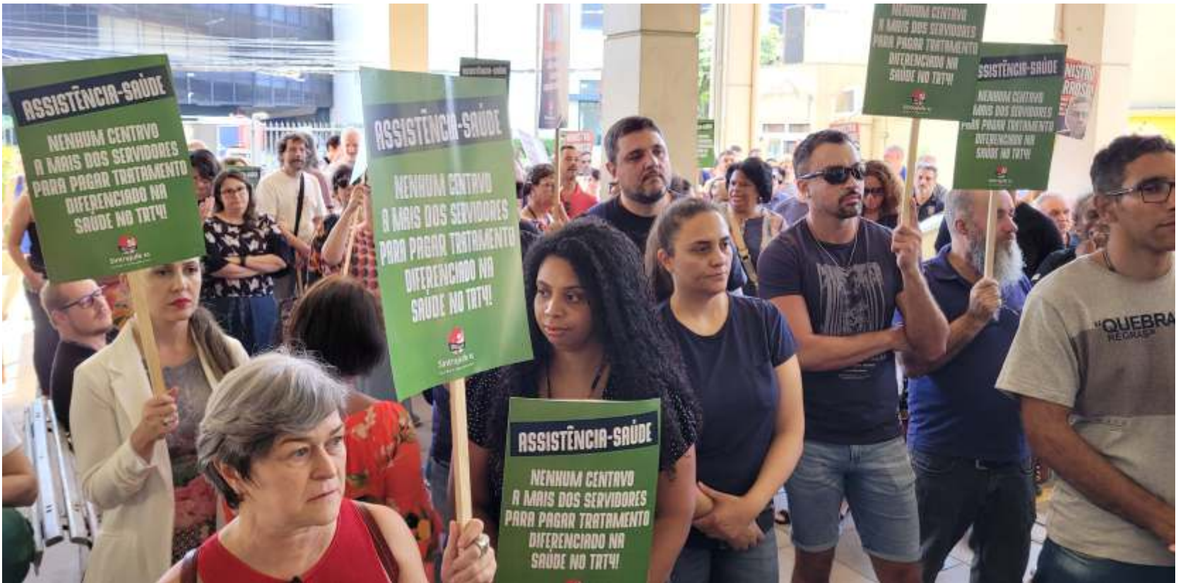
Ato público, em março, nas varas trabalhistas exige isonomia entre servidores e magistrados

▶ O Sintrajufe/RS convoca os servidores e as servidoras da Justiça do Trabalho para ato público no dia 5 de novembro, às 13h, nas varas trabalhistas de Porto Alegre. A mobilização foi aprovada na assembleia de base realizada em 14 de outubro, a fim de pressionar o CSJT pelo aumento emergencial do subsídio do plano de saúde do TRT4, que está congelado em R$ 546,00 desde 2022. O reajuste dos valores do novo contrato com a Unimed foi de 30%, em média, e passa a vigorar a partir de 1º de novembro.